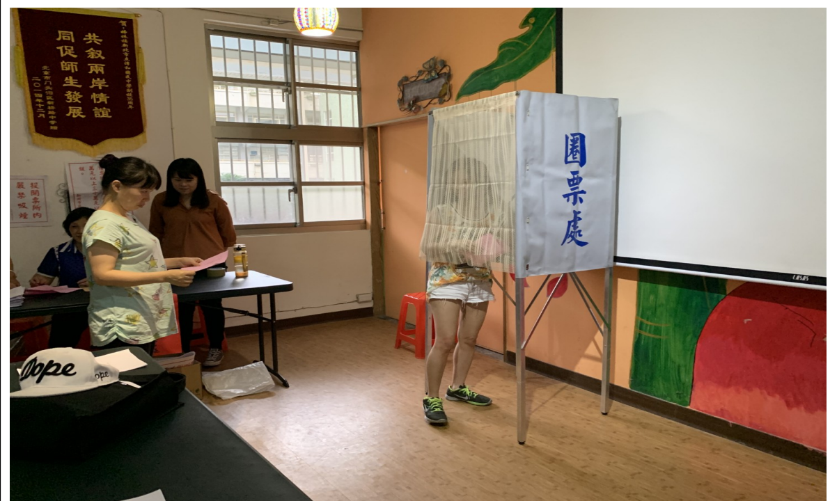
說明：模擬投票情形