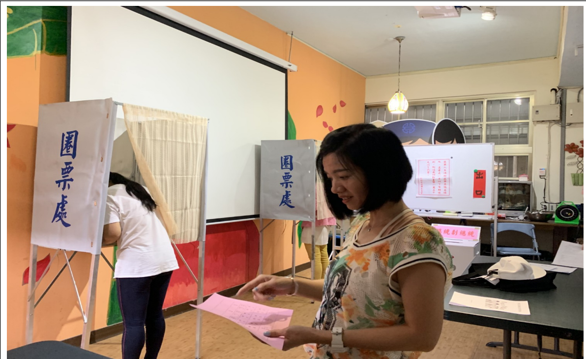
說明：模擬投票情形