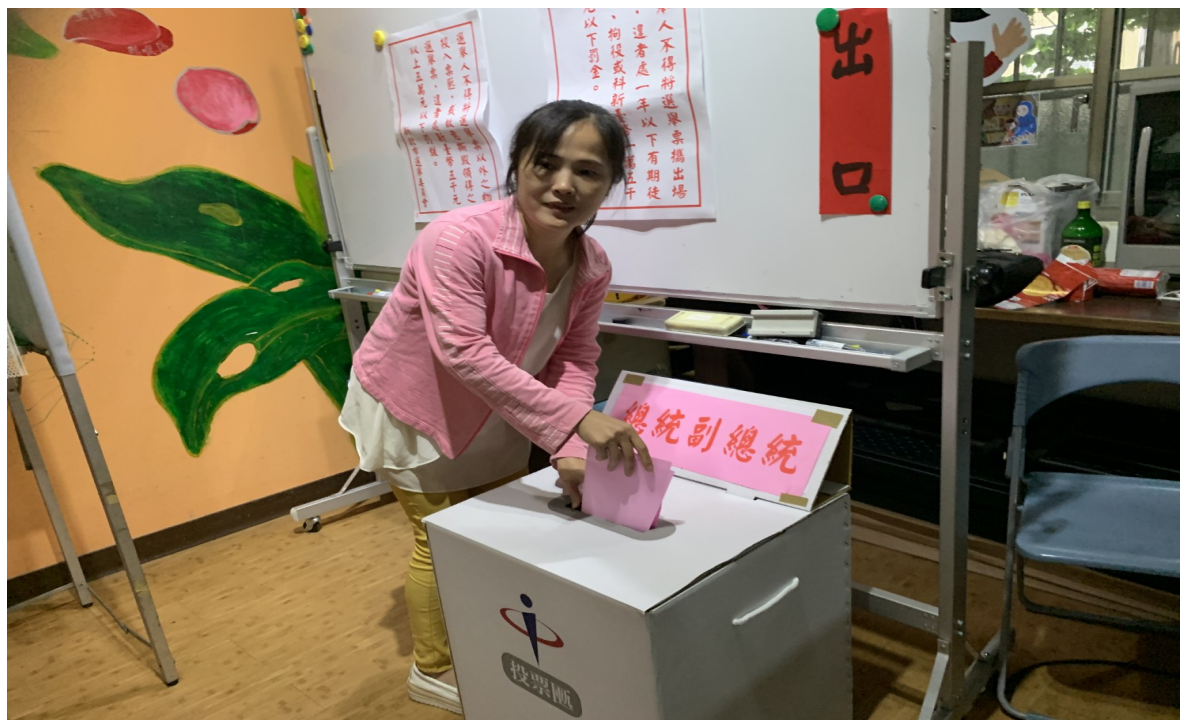
說明：模擬投票情形