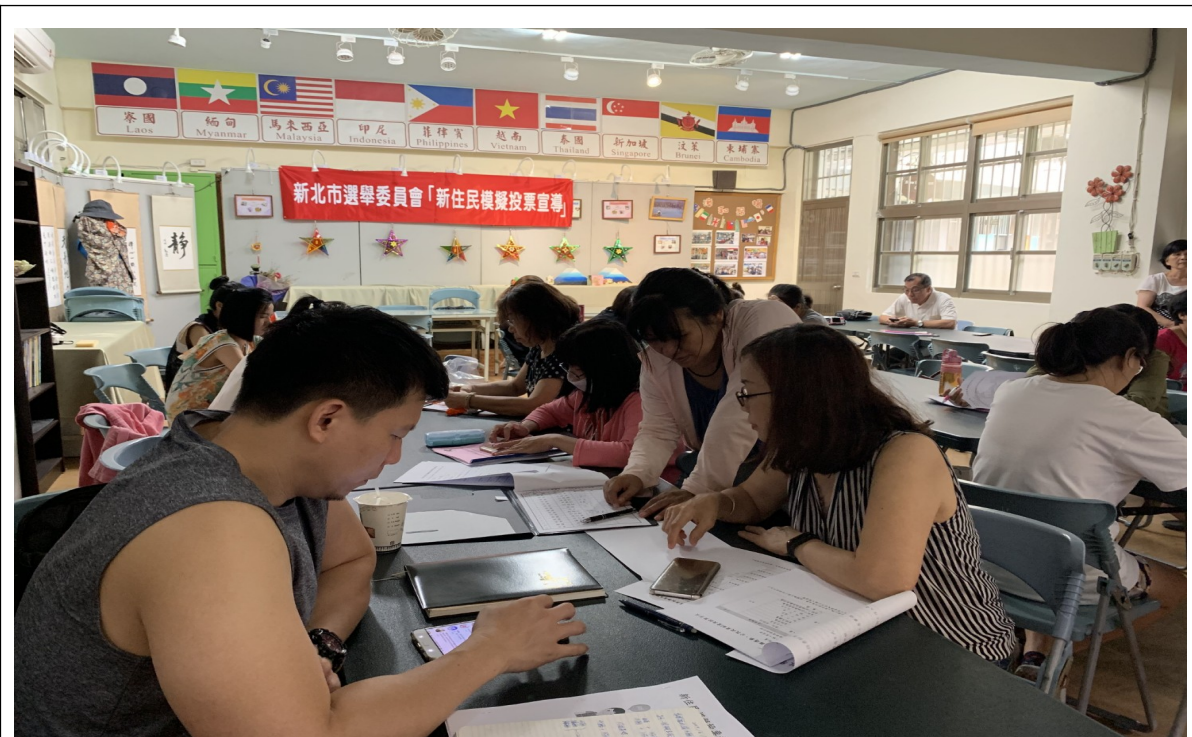
說明：學員上課情形