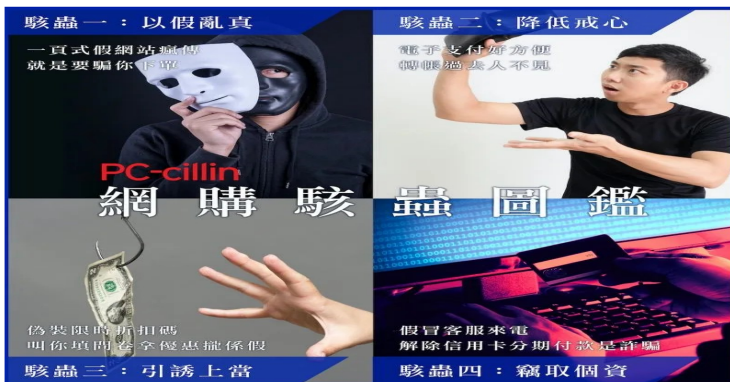
▲趨勢科技公布網購4大駭蟲圖鑑，提醒民眾留意網路中暗藏的詐騙危機，以及各種資料外洩遭盜用的風險。

詐騙集團駭入購物平台後台資料庫的事件頻傳，目的是竊取民眾消費資料及付款方式等個資，然後再假冒購物平台客服打電話給消費者以工作人員操作錯誤，需要解除分期付款詐騙手法，要求民眾前往操作 ATM、網銀匯款或購買遊戲點數來解除設定。提醒民眾如接獲不明的來電顯示，並在電話中聽到如「解除分期付款設定」、「重複扣款」等關鍵字，應立即掛斷電話，切勿聽從指示進行轉帳。