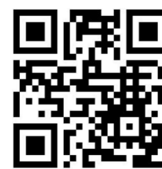
衛生福利部疾病管制署

( https://www.cdc.gov.tw )及中央選舉委員會網站( https://www.cec.gov.tw )。