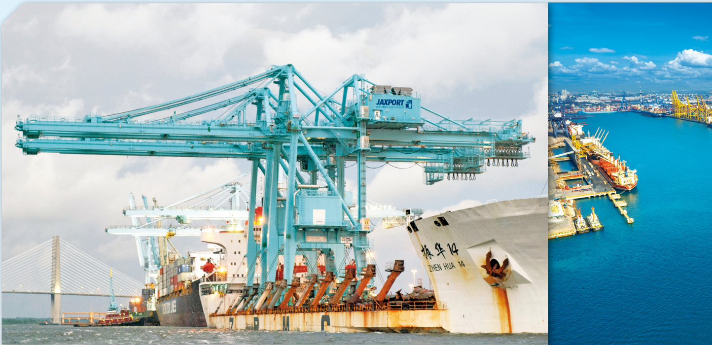
位在美國各主要港口的起重機（俗稱天車）絕大部分由中國交通建設集團的子公司—振華重工所製造，美國國防部針對其硬體與軟體產生惡意監控、情報外洩之疑慮。

曾一度被質疑、但沒被擴大檢視或尚未引起社會關注？本文相信特洛伊木馬不會只有天車這項設備，一定還有曾出現在其他場景、且被大量需要的設備或產品。