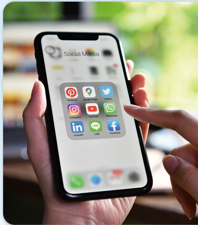
安裝在 3C 設備中的軟體與程式是最難提防的，其方便性與有趣的數位內容促使人們在使用上不加思索。

功能、有的以社群軟體或數位平臺運作，又或者充滿了各種炫目、有趣的數位內容來吸引人們使用（特別是青少年更成為重度使用者），尤其是抖音（TikTok），更是國際間關注的焦點。今年 3 月初，美國眾議院外交委員會授權禁止 TikTok 用於美國的所有設備中；有部分眾議員更直指，TikTok 就像是「手機裡の間諜氣球」，而在今天來看，這個比喻非常寫實。