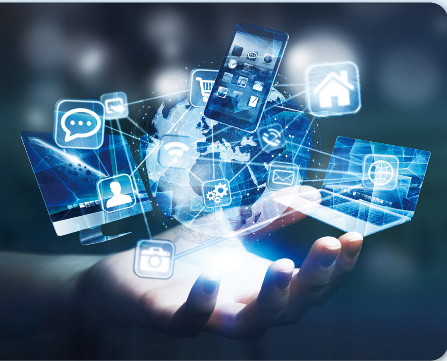
日益精進的智慧化技術使得設備裡的操作介面與軟體都有可能被植入程式而成為個人日常生活被監控與滲透的載具。